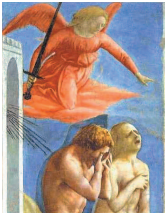
La cacciata di Adamo ed Eva dal Paradiso Terrestre, dipinta da Masaccio

Il serpente era la più astuta di tutte le bestie selvatiche fatte dal Signore Dio. Egli disse alla donna: – È vero che Dio ha detto: non dovete mangiare da nessun albero del giardino?